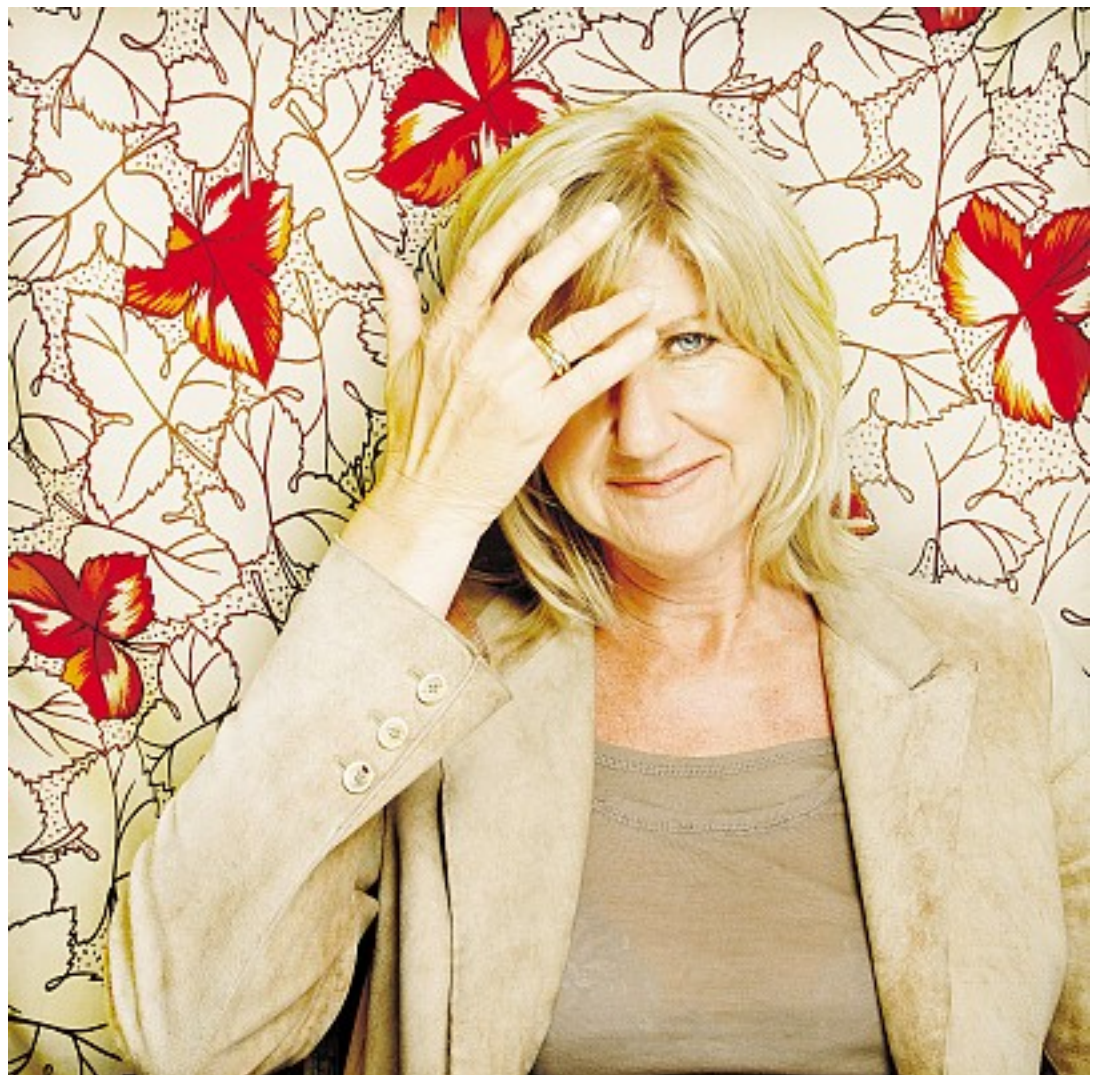
Hodepinen borte Anne Grete Preus er nettopp helbredet fra sterke hodesmerter og livsfarlig svulst i binyren. – Det var godt å vite at plata var ferdig da jeg lå syk, for da ble alt annet enn helsa helt uviktig, forteller artisten.

– Jeg har hengt i en tynn tråd, som DumDum Boys sier, og da lærer man mye om sin egen styrke og det som er viktig. Det er så mange forstyrrende tanker som preger livet. Kravet om å være vellykket, hva andre synes. Alt sånt som har med fasade å